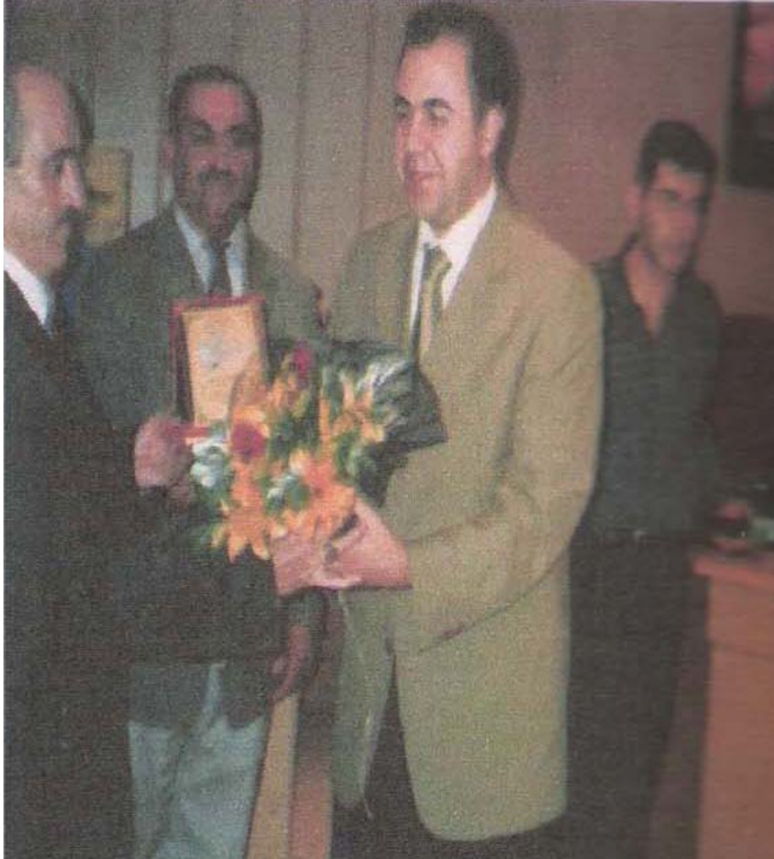
MAKEDONYA'DA BİR KONSER SONRASI, MAKEDONYA/ TETOVA BELEDİYE BAŞKANI İLE BİRLİKTE. MAKEDONYA/ TETOVA 2000